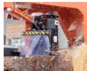
Barkfräs som tillval