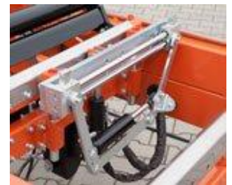
"Hold Down" Klamp som tillval