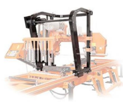
Nya X-Frame Såghuvudet