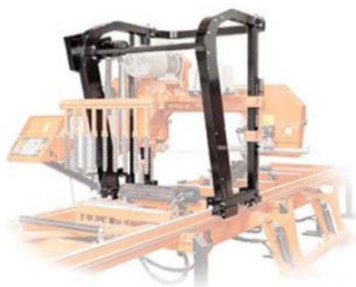
Nya X-Frame Såghuvudet