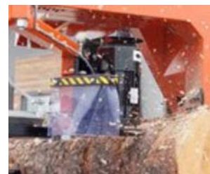
Barkfräs som tillval