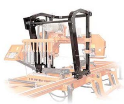
Nya X-Frame Såghuvudet