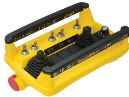
Radiostyrning av såghuvud AC