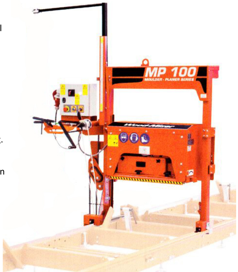
På bilden: MP100 med elektrisk motor på sågram till LT10 - LT15

Om ni inte har ett LT10/15 kan ni köpa en sågram till en sådan så är MP100/MP150 blir en komplett separat enhet!