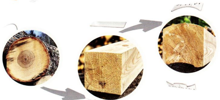
Från rund stock