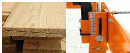
Fjällpanel Tiltning av såghuvud