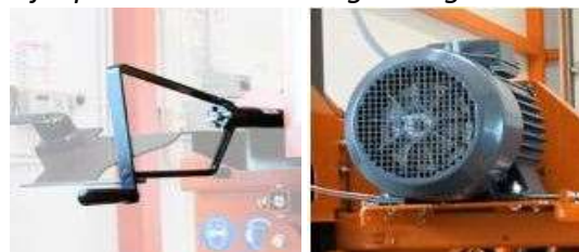
Vev till höjdinställning, 5,5kW el-motor