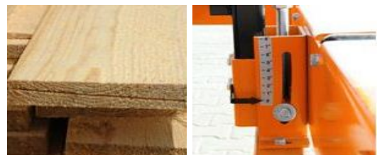
Fjällpanel Tiltning av såghuvud