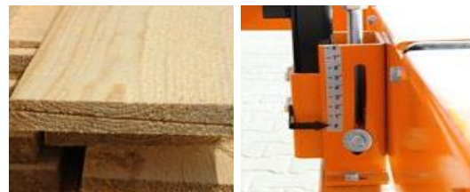
Fjällpanel Tiltning av såghuvud